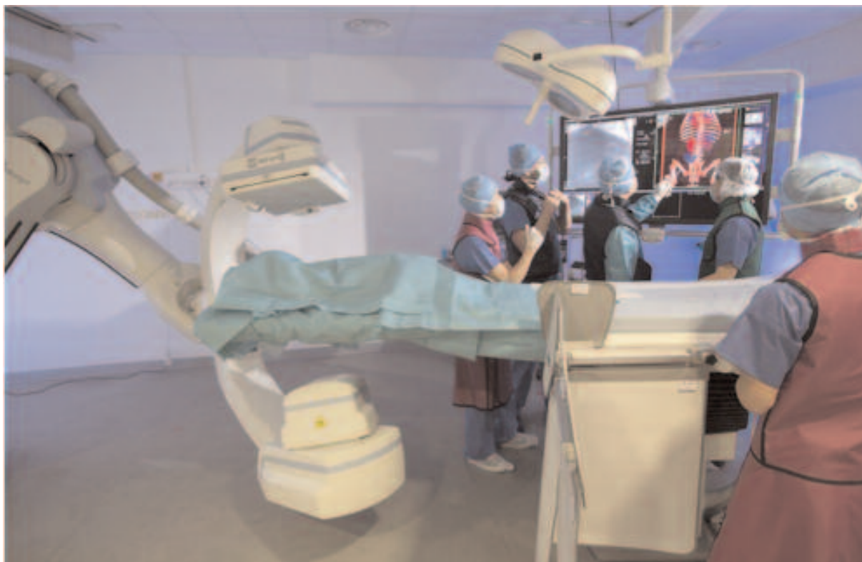
Chirurgie non invasive (Strasbourg)

Les ressources nécessaires, publiques et bancaires, ont été sécurisées pour un investissement annuel de 4,5Md€ spécifiquement dédié à la modernisation des hôpitaux sur nos territoires.